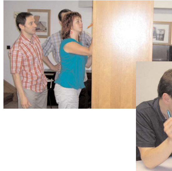
Bankoako hainbat langile Euskara Batzordean lanean.

Elhuyar Aholkularitzak euskarak Bankoan bizi duen egoeraren diagnostikoa egin zuen eta, horren arabera, langileen erdiak baino gutxiagok zekien euskaraz. Gainera, ez zegoen finkatuta bezeroekin erabili beharreko hizkuntzaren inguruko irizpiderik; langileen esku zegoen zein hizkuntza erabili hautatzea. Bestetik, barne-komunikazioan gaztelania zen nagusi.