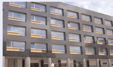
Leioako bulegoa, Ikea eraikinean.

Euskarak inoiz baino taupada zuzenago gorri gehiago du. Izan ere, euskararen ezagutzari eta erabilera buruzko datuak jasotzen hasi zirenetik, inoiz baino euskaldun gehiago dago Bilbo Handian. Hogeita urtean % 7,6 hazi da euskaldun kopurua eta egun biztanleriaren erdia (% 43,1) euskalduna edo euskalduna da. Gazteei errepantzen badiegu, % 78,8 da euskalduna edo ia euskalduna. Etorkizunak, beraz, euskararen doinua du. Baina erakunde nahiz enpresak prest al daude seietore gero eta handiago horri zertutzuzak nahiz produktuak euskaraz eskaintzeko?