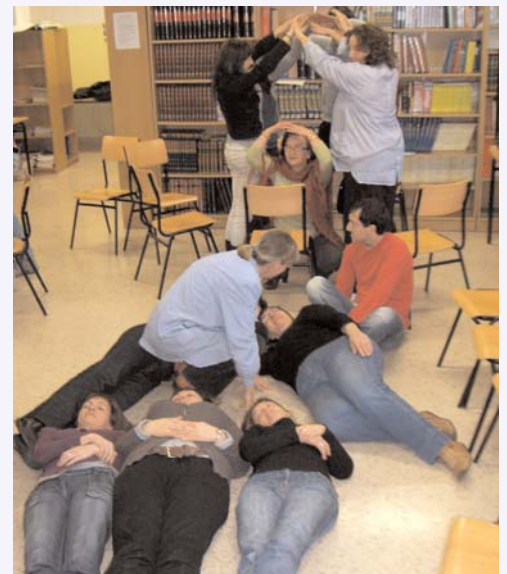
Irakasleak taldea talde dinamika batean.

Horretarako, beraien eguneroko jardunean sortutako beharrak, interesak eta hutsuneak identifikatu zituzten, Elhuyar Aholkularitzak erabili ohi dituen talde-dina-